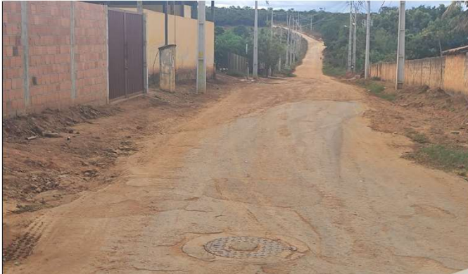
FOTO INÍCIO TRECHO DA RUA