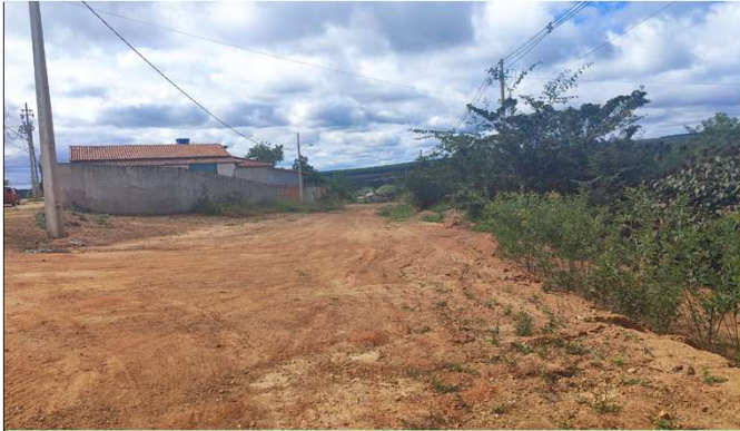
FOTO INÍCIO TRECHO DA AVENIDA