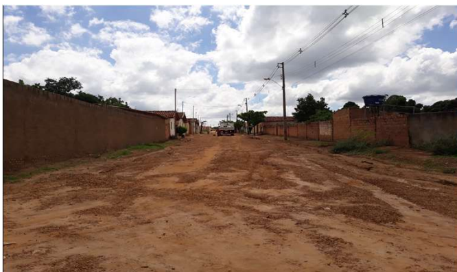
FOTO INÍCIO TRECHO DA RUA