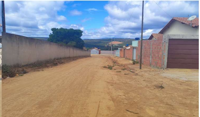
FOTO MEIO TRECHO DA RUA