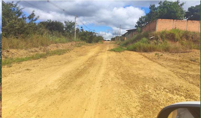
FOTO MEIO TRECHO DA AVENIDA