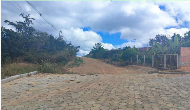
FOTO FINAL TRECHO DA AVENIDA