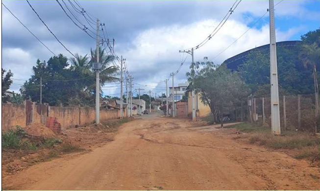
FOTO FINAL TRECHO DA RUA