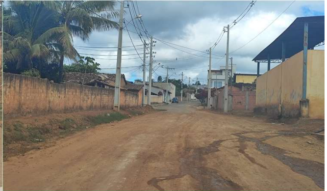
FOTO MEIO TRECHO DA RUA