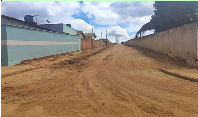
FOTO FINAL TRECHO DA RUA