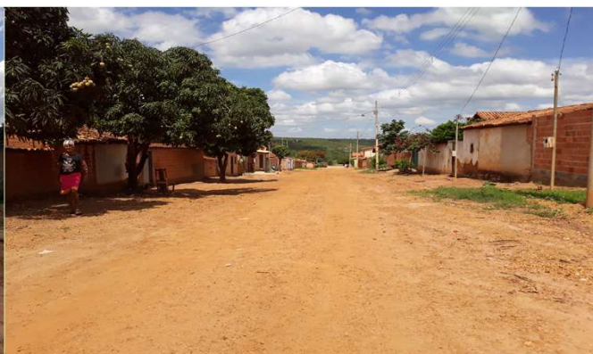
FOTO FINAL TRECHO DA RUA