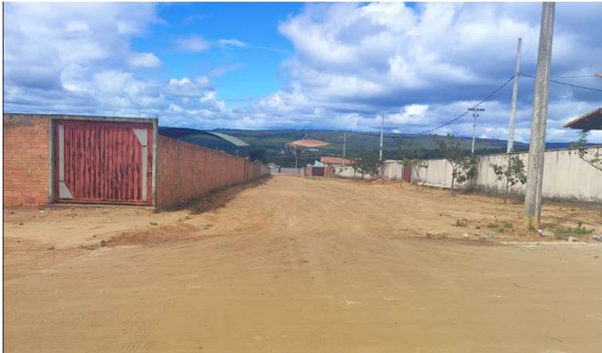
FOTO INÍCIO TRECHO DA RUA